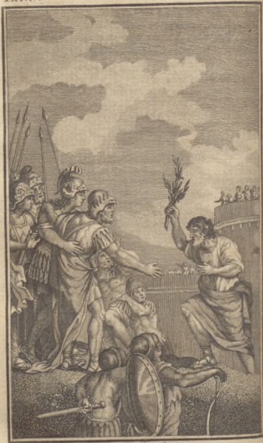
L. y. Mente la grabaron.