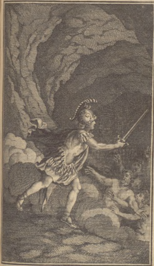
2 e . y. Mars la gubavit.

Telemachus va chercher son père aux enfers.