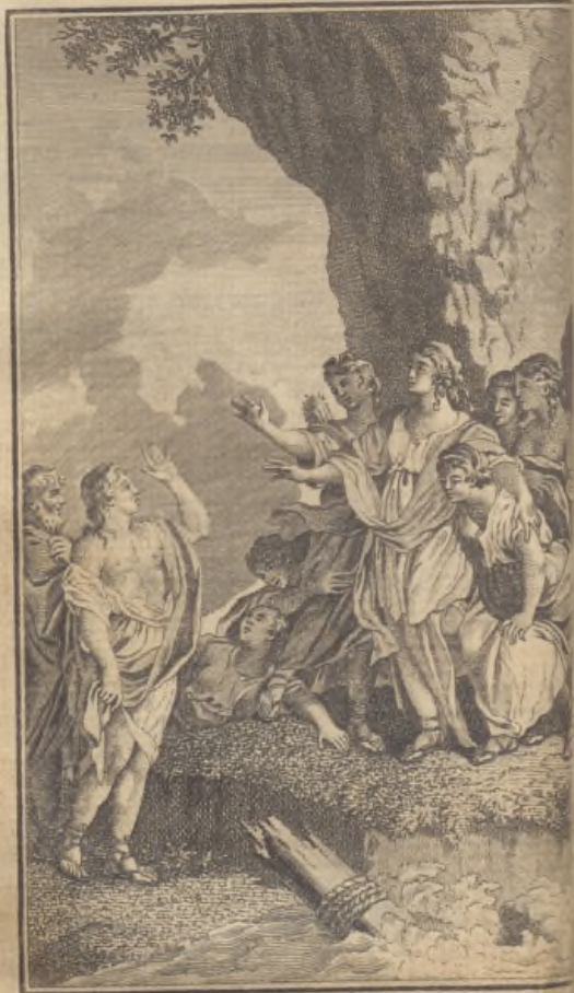
L. y. Mau' le arborer.