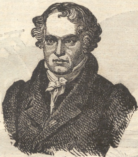
(Alejandro de Humboldt.)

fuerte resolucion, un grande amor á la ciencia para exponer así su vida sin otro obgeto que el de fijar una duda ó determinar la posicion de un punto sobre la superficie de la tierra.