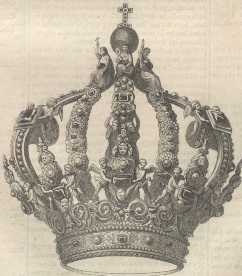
CORONA IMPERIAL DE LA VIRGEN DEL SAGRARIO EN TOLEDO.

Se ha repartido ya el programa de los conciertos que han de verificarse esta primavera en el teatro y Circo