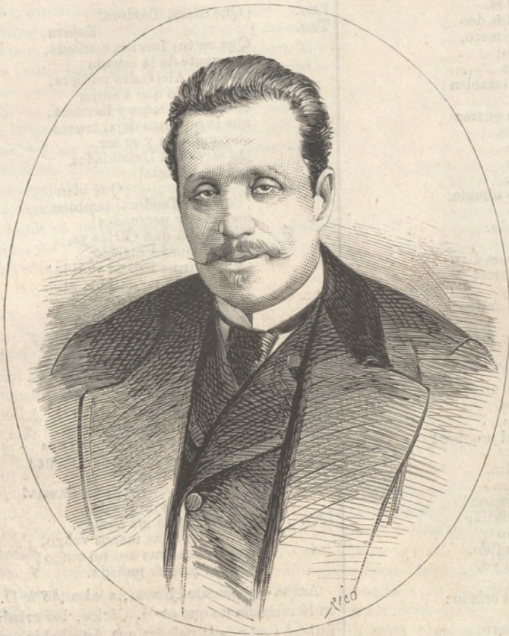
DON CRISTÓBAL OUDRID.