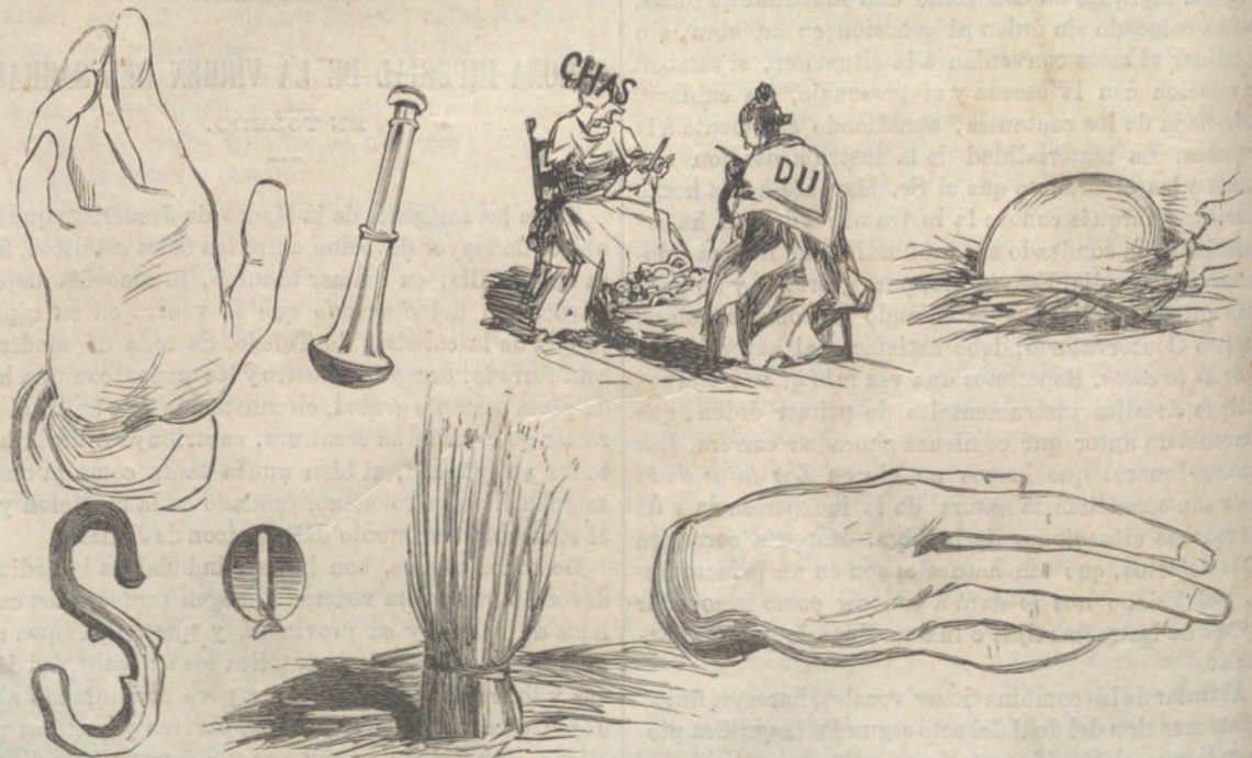
Solucion al publicado en el número anterior: