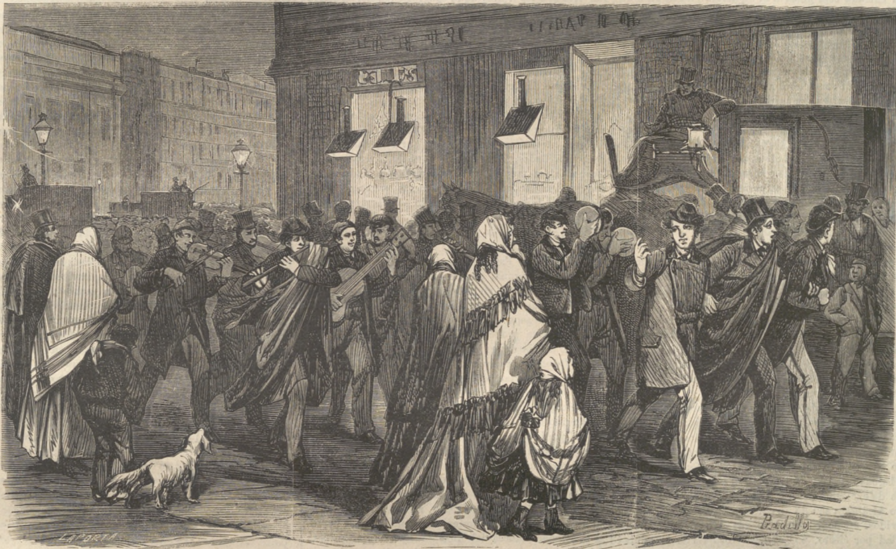
LA ESTUDIANTINA EN VÍSPERAS DEL CARNAVAL.

la capilla de San Juan Bautista, mandada construir en Roma por el derrochador D. Juan V; es obra de los mejores artistas de la época y está adornada de materiales preciosos, como granito oriental, pórfido, alabastro, amatista, coralina, lapislázuli y plata. Hay allí cuatro cuadros en mosaico que representan el bautismo de Jesús, la Anunciacion y el descenso del Espíritu-Santo, considerados como obras maestras de los mejores artistas italianos; toda la capilla vino desarmada y embaldada de Roma después de haber oficiado en ella el Papa y fué expuesta al público en 1751. ¡Este capricho real,