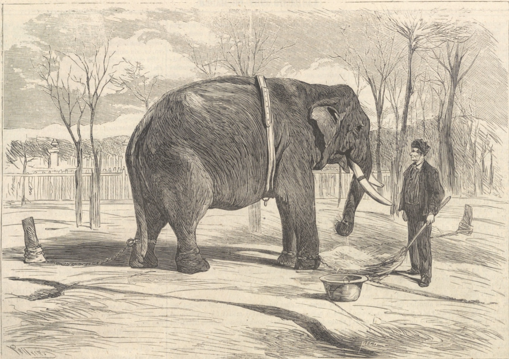
EL ELEFANTE PIZARRO.