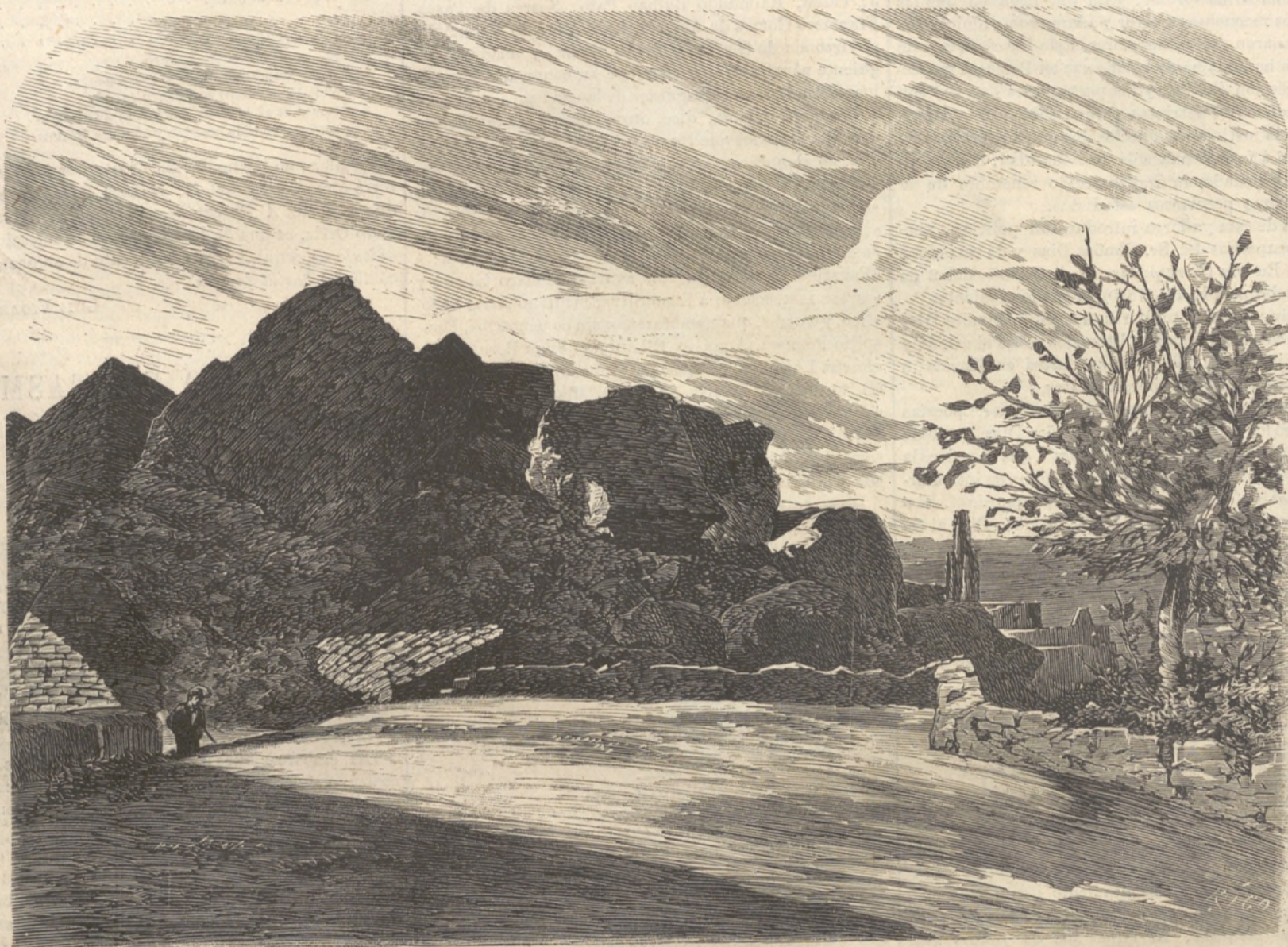
LOS MUROS DE GERONA.

de saludo, é izó en su palo mayor una gran bandera negra, en el centro de la cual se veía bien claramente una calavera blanca y dos tibias puestas en cruz.