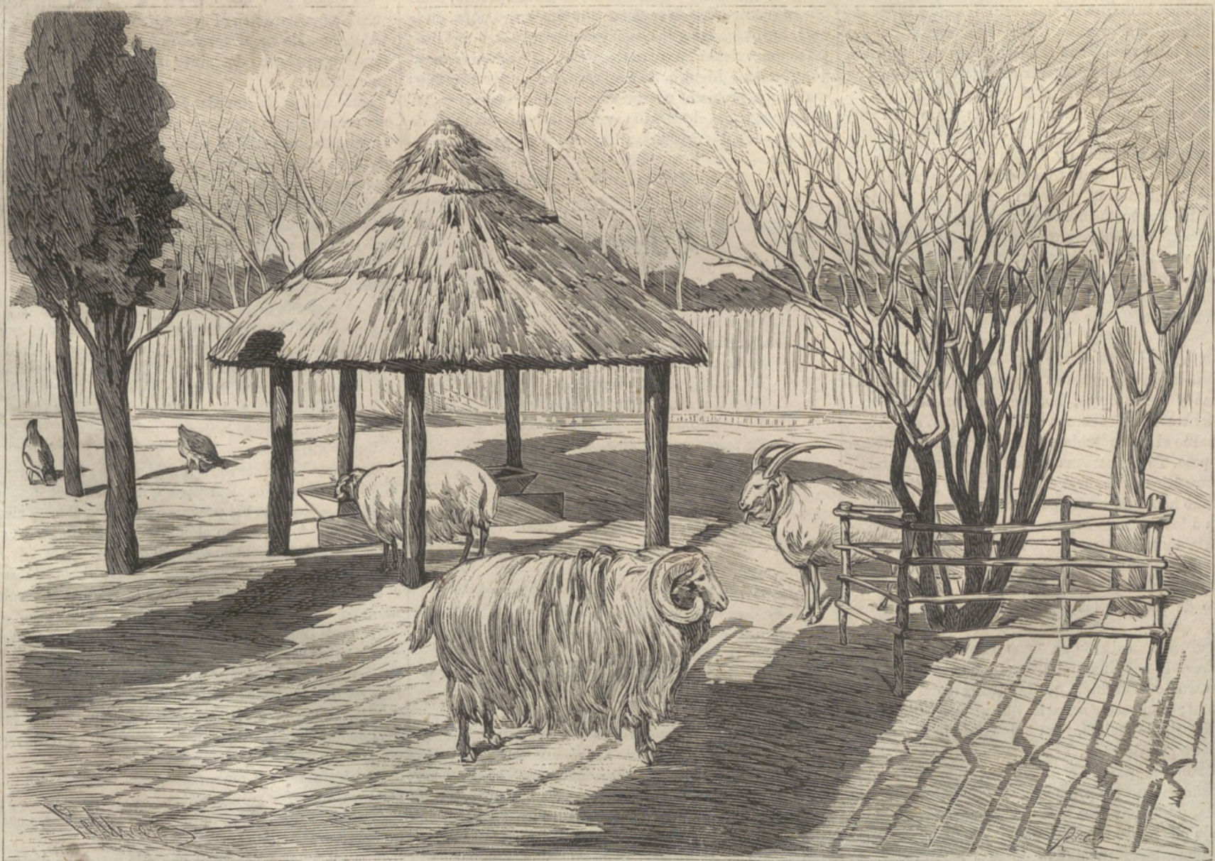
CARNEROS DE ASTRAKAN.