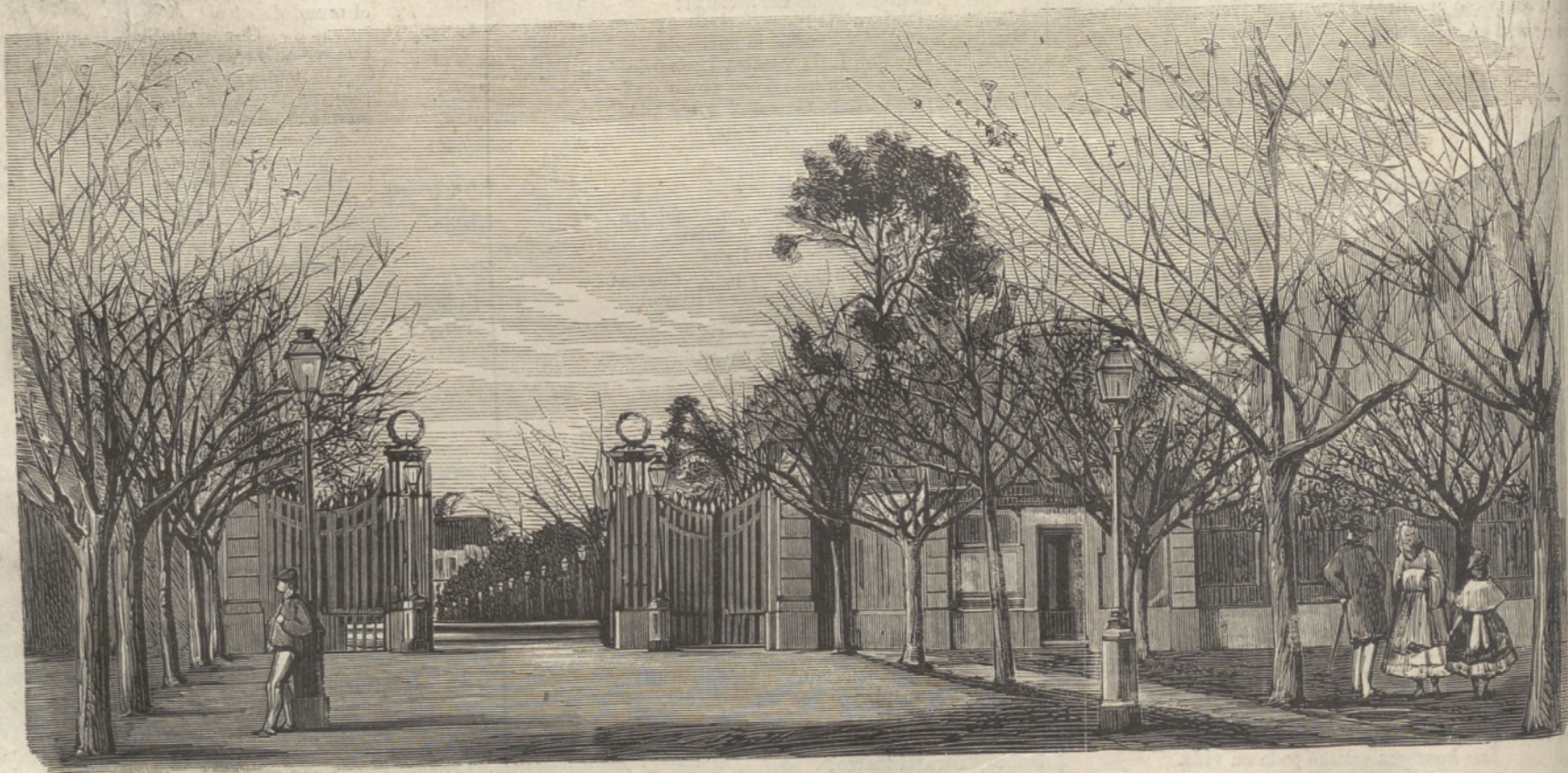
LISBOA EN 1870.—PÓRTICO DO PASSEIO PÚBLICO.

putado el nacimiento del uno; Lisboa y Coimbra, la ciudad universitaria, el del otro: el que nació en Alcalá era de mediana estatura, blanco, buen color, pelo castaño, barba y bigote rubios, ojos alegres, nariz corva; el que nació en Lisboa era de mediana estatura, blanco, buen color, pelo rubio, ojos vivos, nariz larga, «con una elevación no desairada en la mitad (testigo de ingenio)»; los dos eran de afable, ameno y festivo ca-