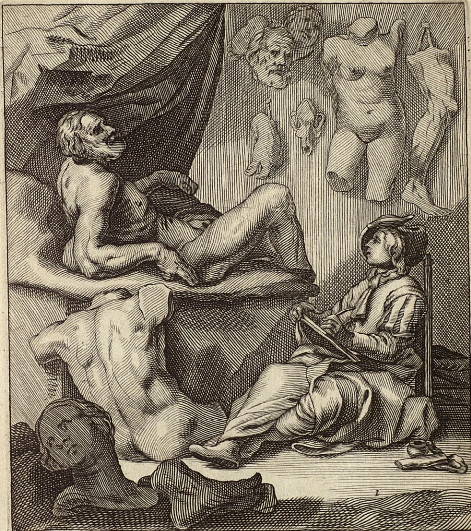
Beelden door A. Bloemaert en J. Callott.