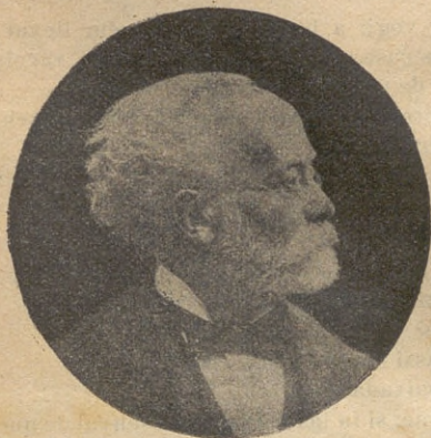
El Mestre Felip Pedrell

El primer acte ensenya com se va concertar el xeflis. Estant a casa la Comtesa grans y xichs y criatures per distréurela en la ausencia del marit, qu'es a viatge, es posa a fer mal temps, y tot esperant que acabi de ploure, cada hù per fer broma hi diu la seva, fan comedia, jochs de mans, ballan bastóns y fins cridan a una gitana que'ls diga la bonaventura. La cosa s'engresca y es quan determinan anar al Coll de Pa-