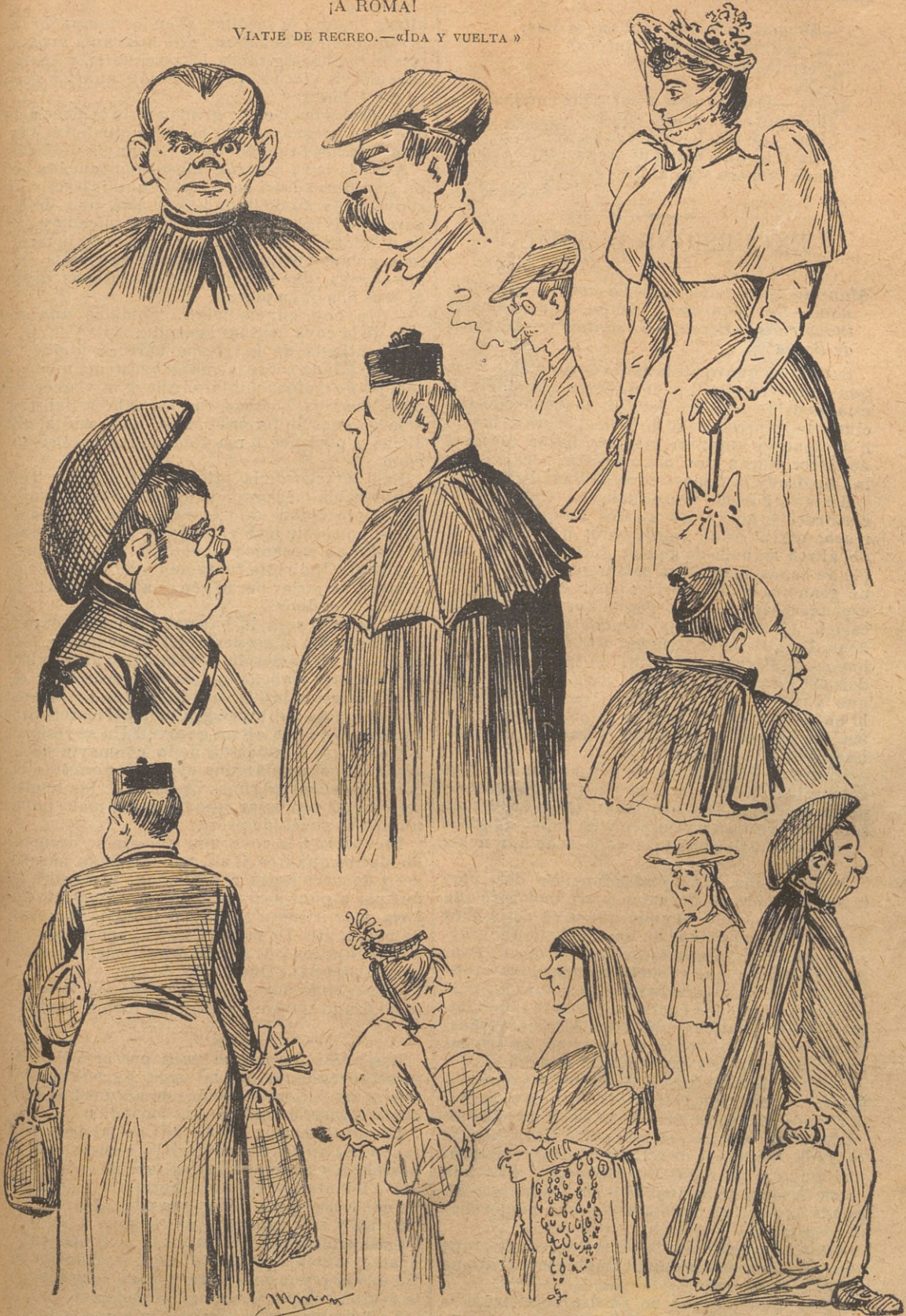
Tipos de pelegrins de la última remesa.