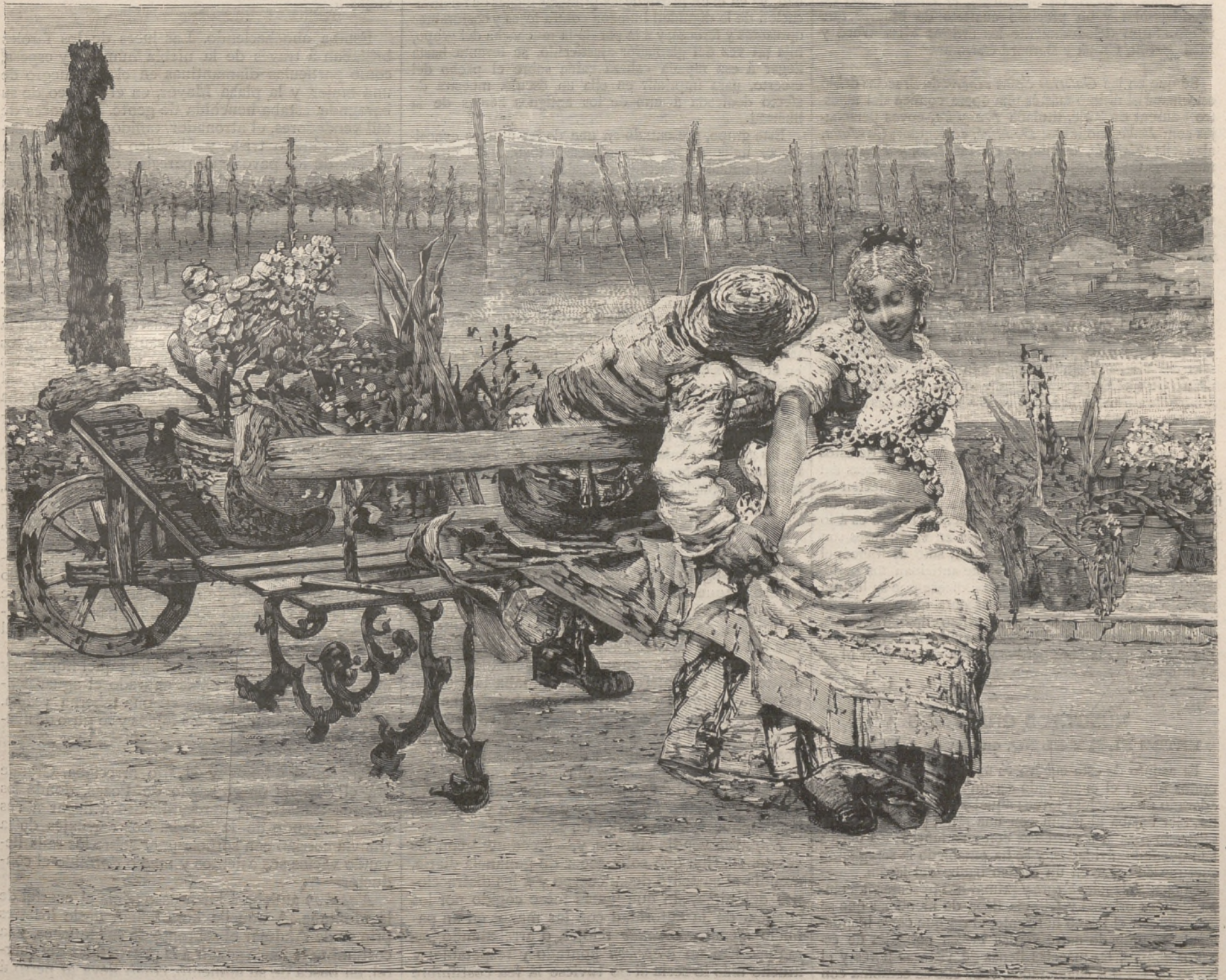
ENTRE EL SI Y EL NO, cuadro de Angel Dall'oca

No fué el juéves, como equivocadamente dije, sino el sábado la inauguración de la temporada en el Teatro Real de Madrid, y preciso la fecha porque de la ejecu- ción de los Hugonotes quedará indeleble recuerdo, sobre todo del famoso duo en que una cantante muy jóven