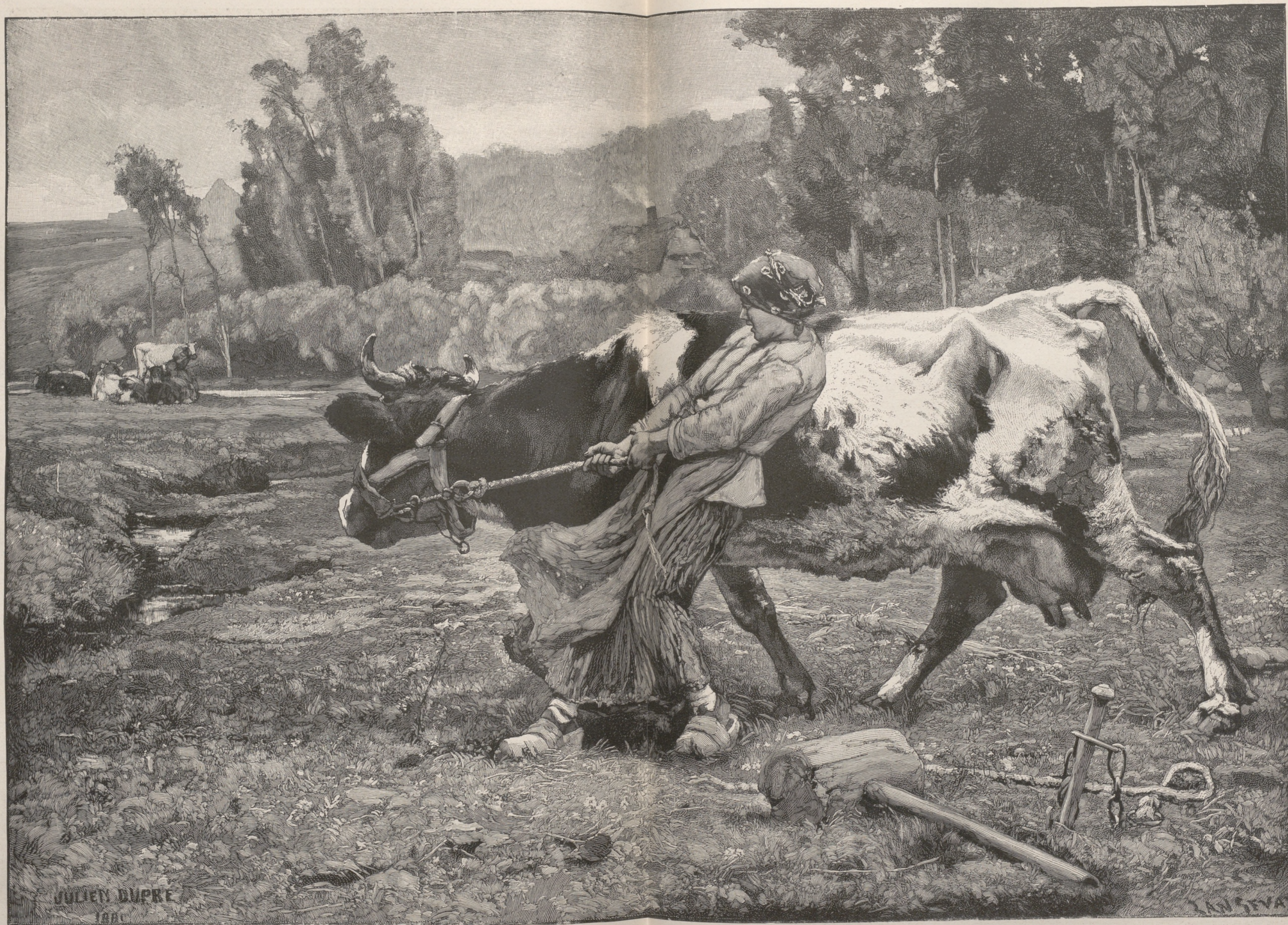
EN LA PRADERA, CUADRO DE M. JULIEN DUPRÉ