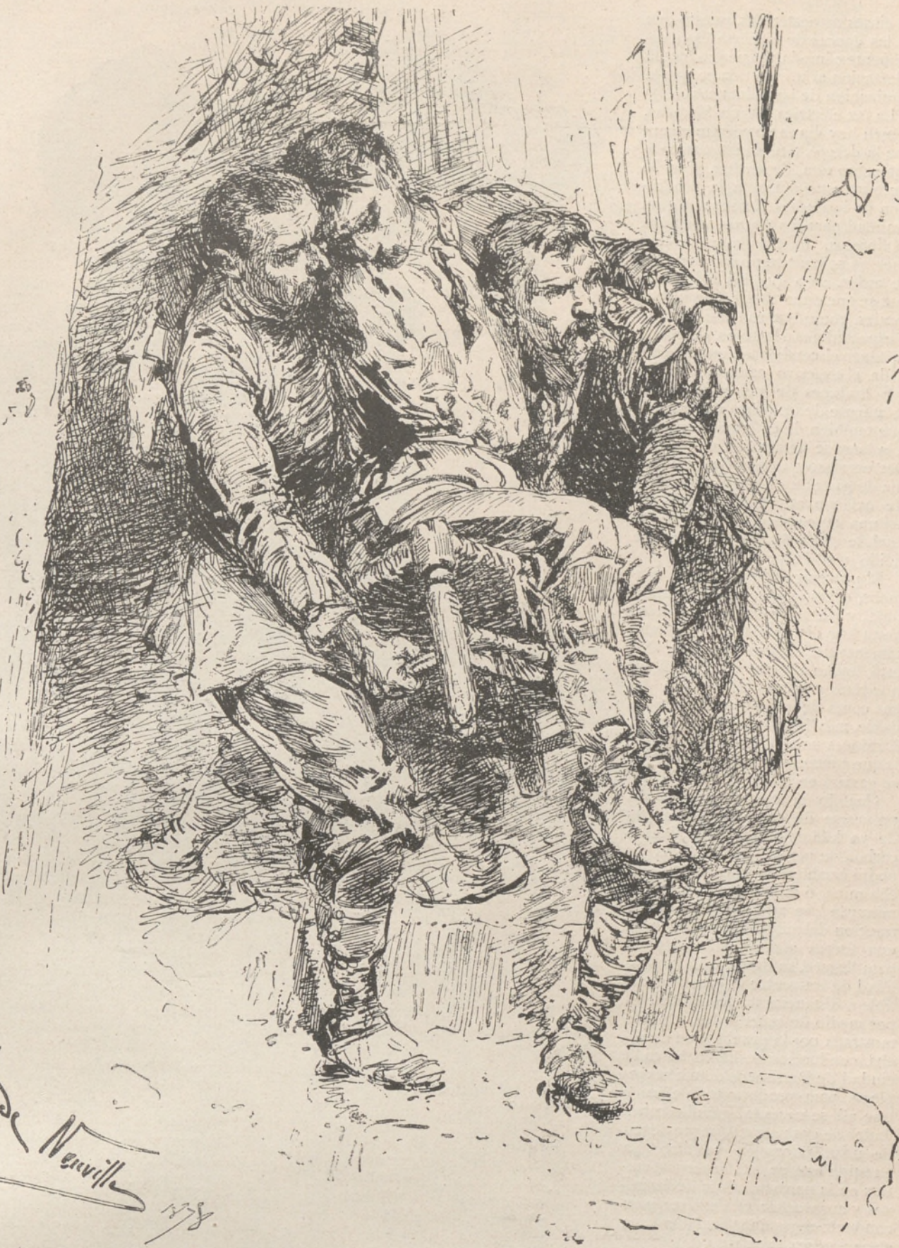
Facsimile de un estudio de A. de Neuville, para su cuadro titulado LE BOURGET

Actualmente se estudia con cierta atencion la conveniencia de la acuñacion de monedas de níquel. Y en efecto, las piezas de este metal resisten mejor las influencias