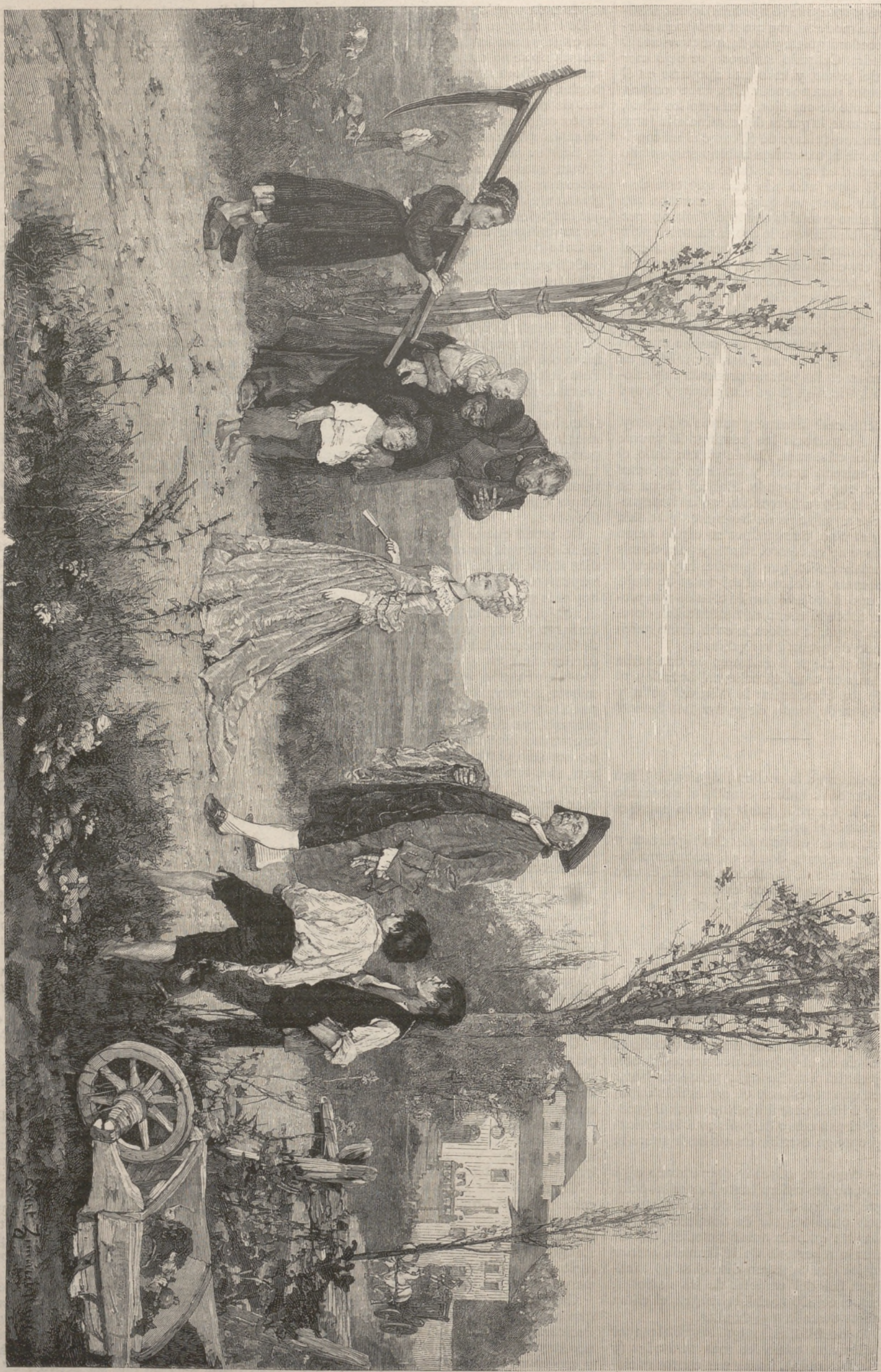
LA HIJA DEL SEÑOR, cuadro de E. Zimena