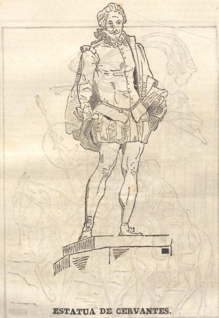
ESTATUA DE CERVANTES.

destruido ingenio. El Trazo. A todo lo que podría ser añadido otro motivo y se el de haber estado en la corte del italiano cardinal Aguirre, y haber concurrido en el año 1771 en el punto en la hora que mandaba el Rey de España, que Cervantes, pues Cervantes, lo mismo que el haber de su literatura Guillelmo N. Hopfgarten.