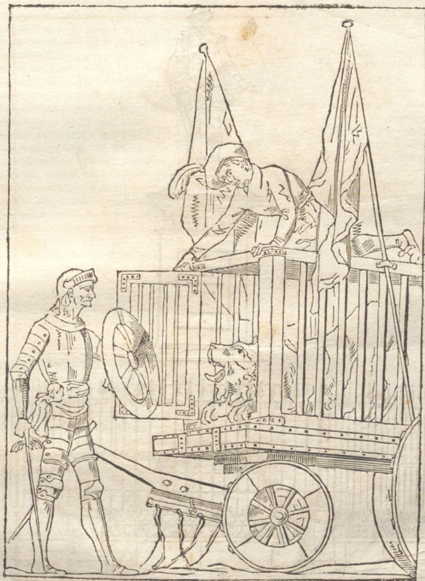
SEGUNDO RELIEVE.—(Aventura de los Leones.)