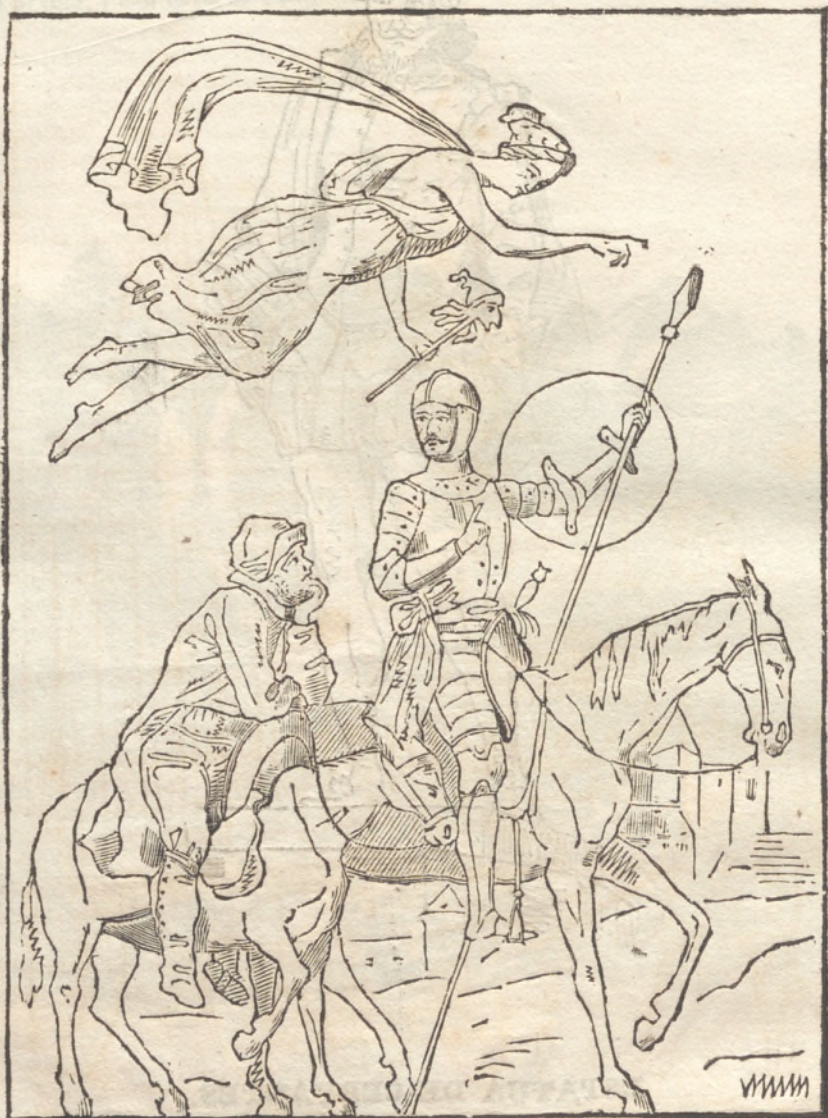
PRIMER RELIEVE.—(Don Quijote y Sancho.)

mo en su singular ingenio y en la pobreza y desgracia se les pareció mucho. Vivió lleno de miseria y murió pobremente á los 69 años en Madrid el 23 de abril de 1616, en el mismo día (cosa singular) en que la Inglaterra perdió al fundador de su literatura Guillelmo Shakespeare.»