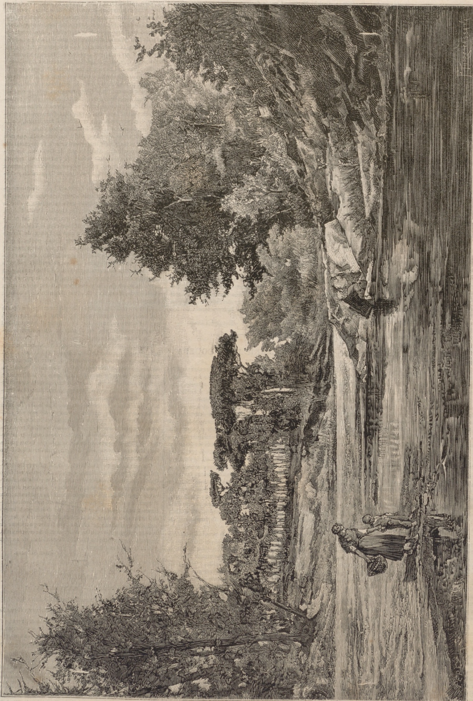
RECORTS DEL VALLÉS. LAS ROQUETAS