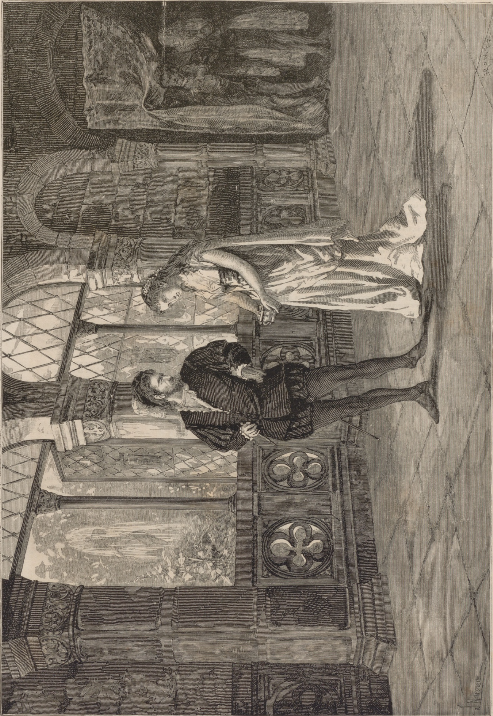
DIBUIX DE J. NARVAEZ