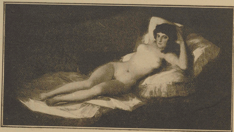
La maja desnuda.