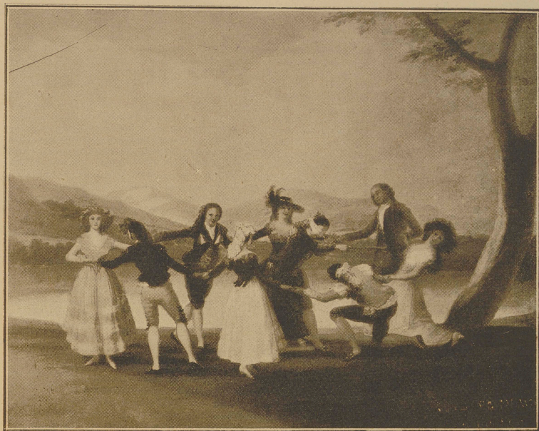
La gallina ciega.