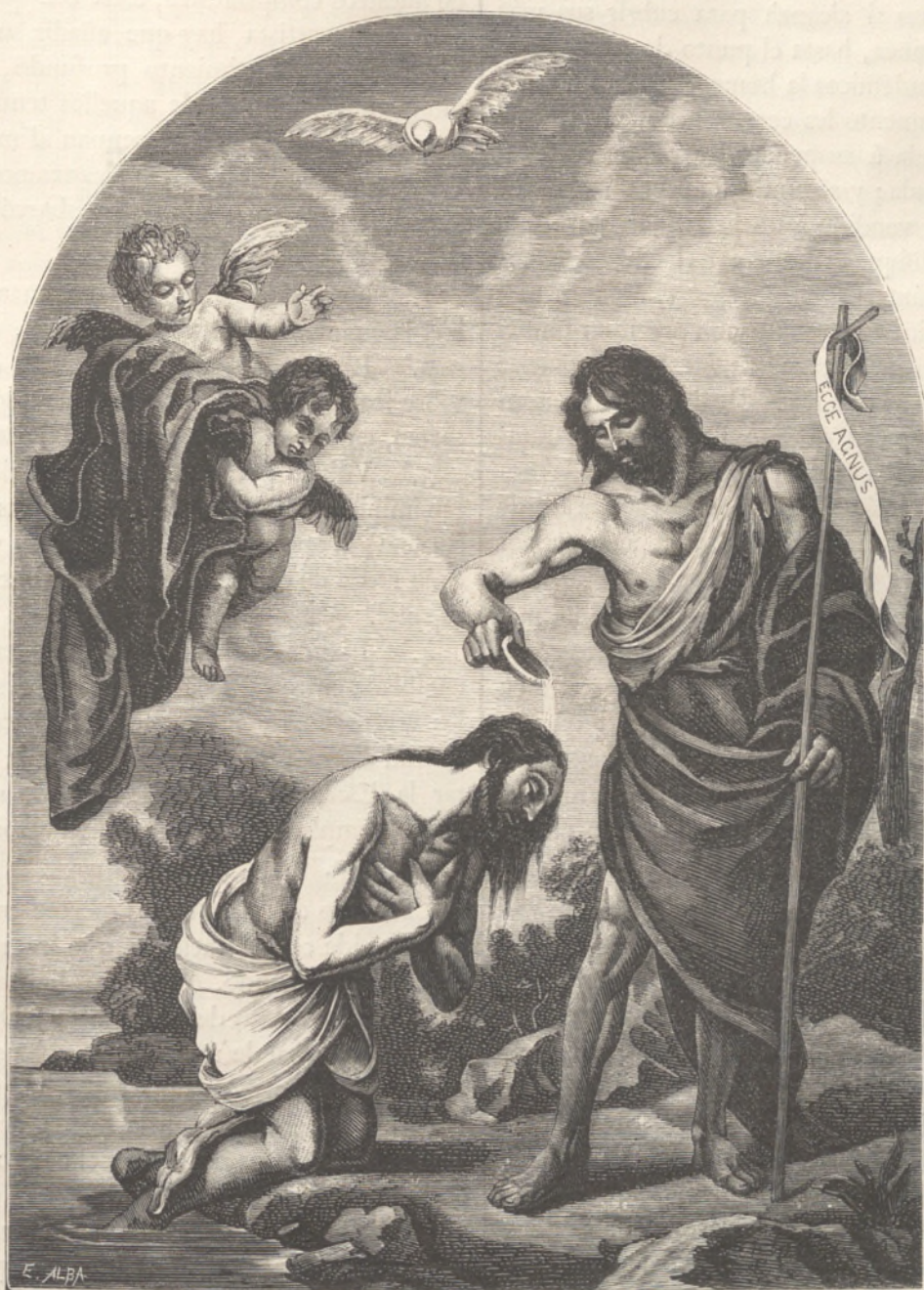
MURILLO. — BAPTISMO DE CRISTO.